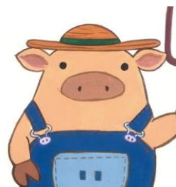
トラクターの運転が得意な ビギーさん