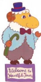
ハートフルタウンの町長 メイヤーさん