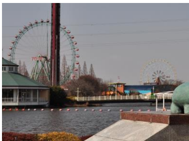
新旧観覧車の競演