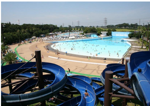
【東武スーパープール全景】

プールで思いっきり遊んだ後、動物園や遊園地を楽しめるのも当園ならではの最高の夏の思い出作りを東武動物公園はお手伝いします!