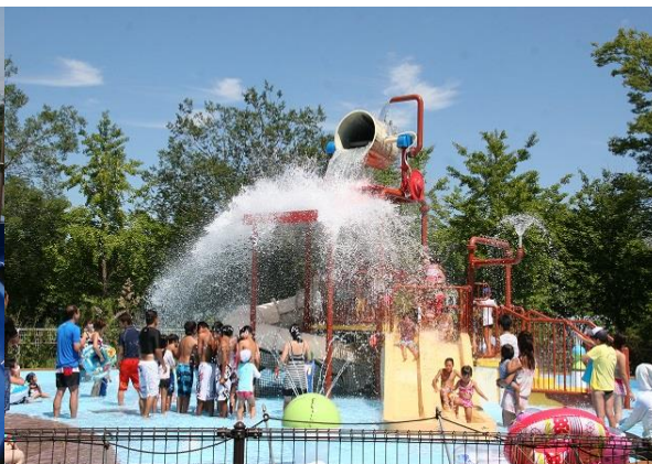
【キッズプール「じゃぶじゃぶアドベンチャー」】