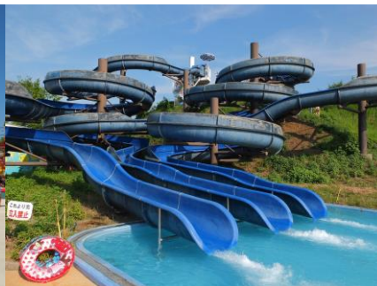
【スーパースライダー】