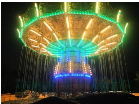
8 月にオープンしたニューアトラクション 「ゴッド・スインガー～オーウェ～」

夏の夜間営業に続き、9 月 13 日(土)・14 日(日)の 15 時以降は、のりもの乗り放題のライドパスが割引となります。※他の割引券との併用はできません。※入園料の割引はございません。