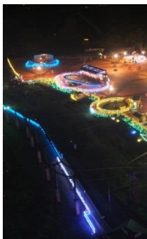
今春オープンした遊園地エリア「ハートフルタウン」 も鮮やかにライトアップ