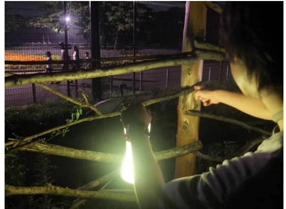
ランタンを持って湿原から里山を散策