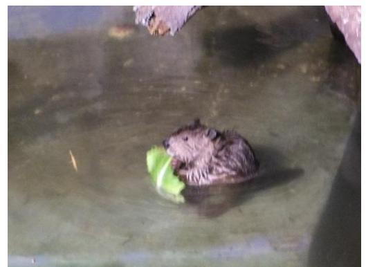
夜活動的なビーバー

開催内容:夜行性のビーバーが元気に泳ぐ姿を見ながら、今年生まれた3兄弟の紹介や誕生秘話などをお話します。