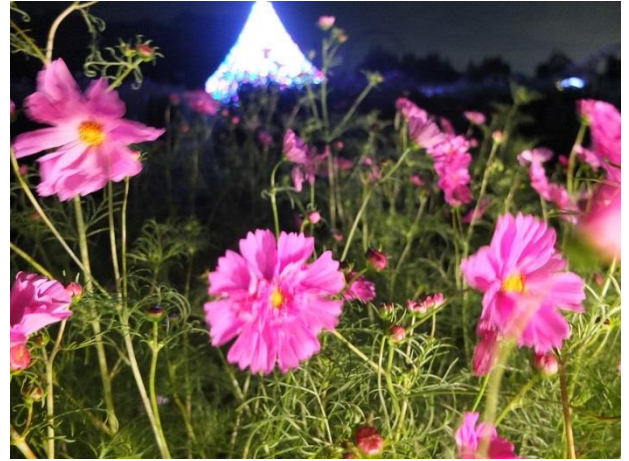
幻想的なコスモスのライトアップ

開催内容:トッピー広場で開催中の秋の花イベント「フラワーガーデン」では、7種、約10万本のコスモスと、お花で作った動物園と遊園地がお楽しみいただけます。イベント当日は、コスモス畑の一部をライトアップして、幻想的な空間を演出します。