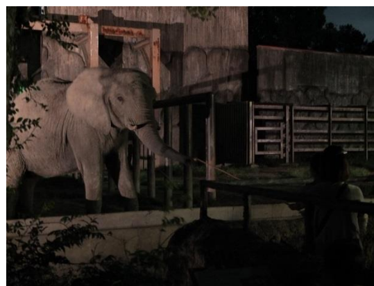
ゾウさんのディナータイム

開催内容:お客様には各動物たちにおやつをあげていただきます。動物たちの日中と夜の違いなどを飼育係に聞いてみてはいかがでしょうか?