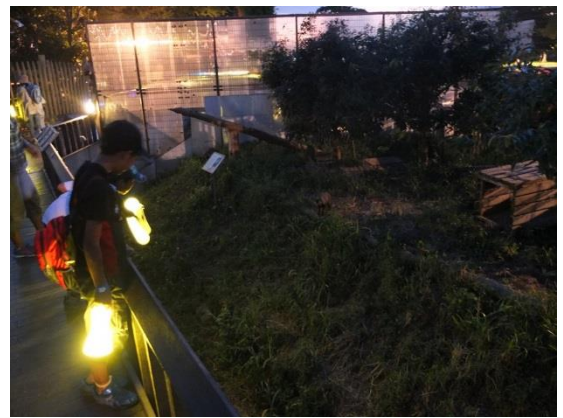
ランタンを持って湿原から里山を散策

開催内容:昔から日本で暮らす動物たちの姿を見ることができる日本産動物舎は、里山の風景を再現した全長約80mのウォークスルー形式の展示施設です。夜間、お客様にランタンを貸出し、場内の湿原から里山への道を散策していただきます。暗闇の中、目を光らせる動物たちやフクロウの飛ぶ姿を目撃できるかもしれません。また、担当飼育係による日本産動物ガイド(18:30~約10分)も開催します。