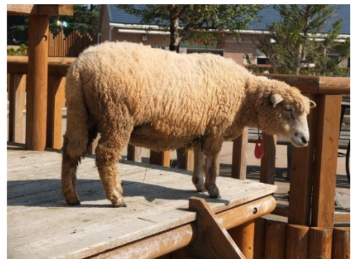
口元のホクロと長いシッポがポイントのアヤメちゃん