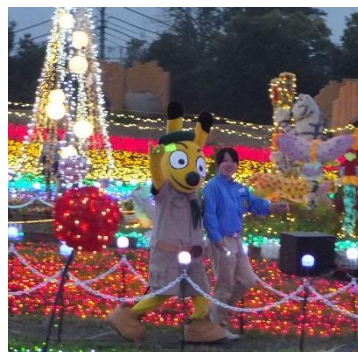
昨年の点灯式の様子