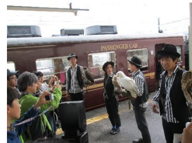
前回のイベントの様子

※秩父神社設置のイベント開催記念スタンプは10/15（土）～30日（日）までの間押印ができます。