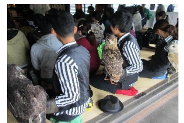
前回のイベントの様子