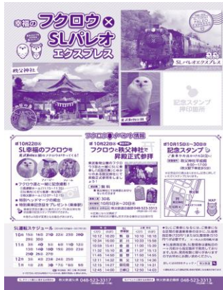
スタンプ台紙イメージ