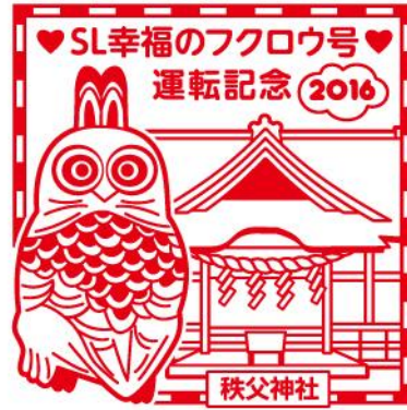
スタンプイメージ