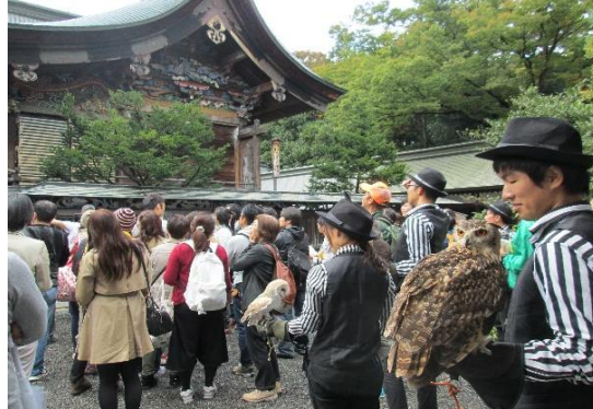
前回のイベントの様子