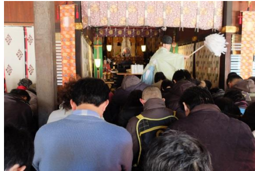
秩父神社 昇殿正式参拝の様子