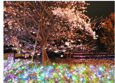
【夜桜ライトアップ(昨年の様子)】